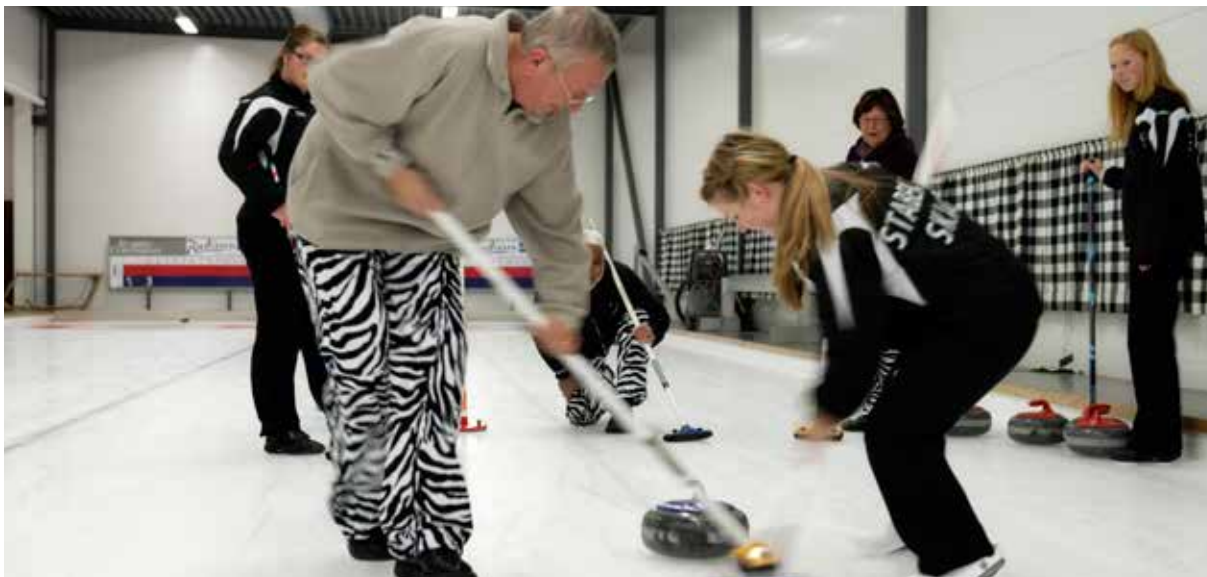
CarciNors Sebra team i samarbeid med Stabekk Curlings jenter

CarciNor er en pasientforening engasjert for en sjelden kreftsykdom. Samarbeid med andre pasientforeninger både nasjonalt og internasjonalt er viktig for vårt engasjement for NET-kreft pasienter og deres pårørende.