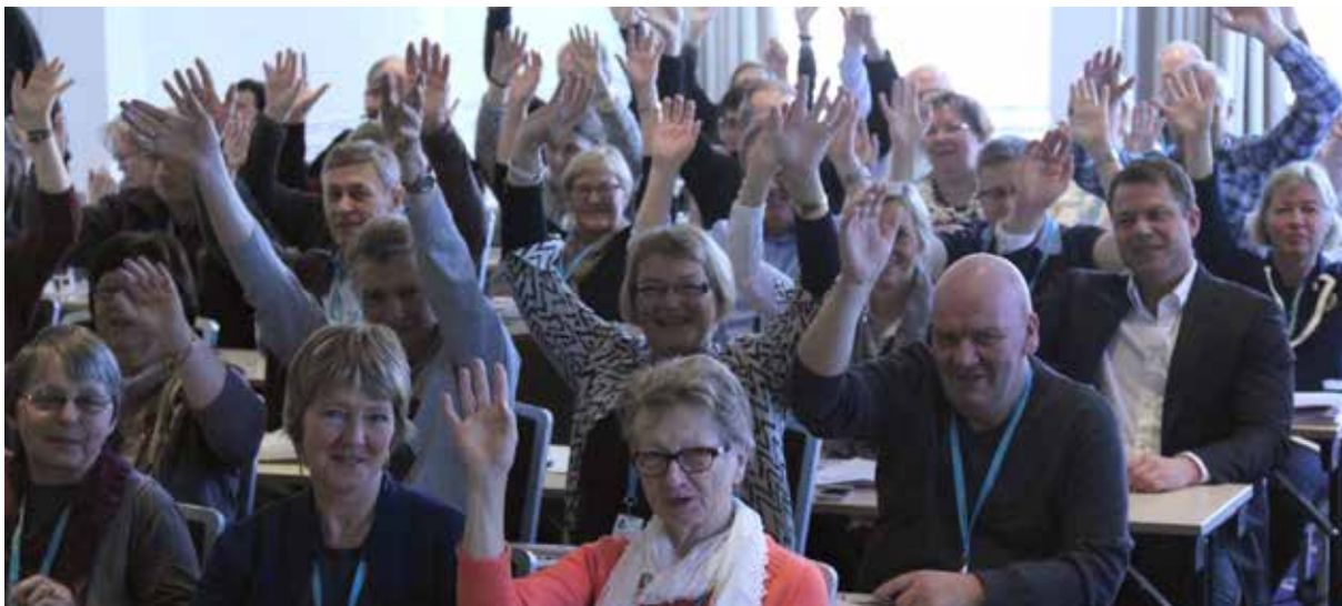
Deltakere på landskonferansen på Lillehammer.

Medlemmene er CarciNors viktigste aktivum. Dette gjelder både aktivitet, økonomi og muligheten til å nå ut med informasjon. Likepersonsarbeidet er en vesentlig del av CarciNors arbeid for medlemmer og personer med NET-kreft og deres pårørende. En likeperson kan gi god støtte og informasjon for de som strever med sykdommen, og ikke minst for de pårørende.